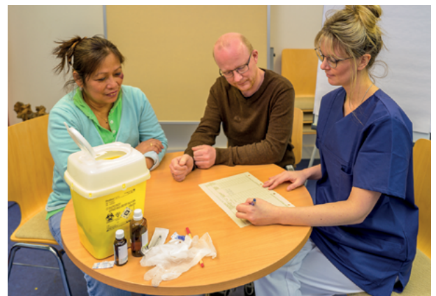
BtM-Dokumentation in Anwesenheit von zwei Zeugen