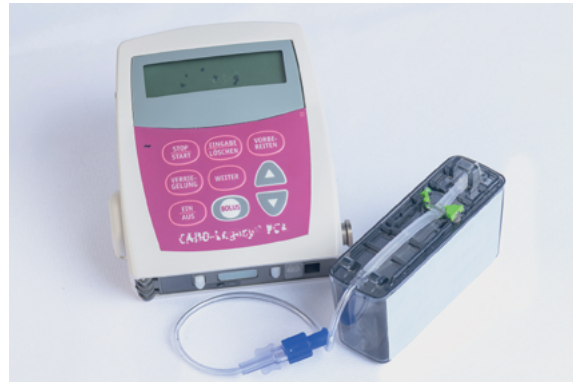
Beispiel für eine tragbare Medikamentenpumpe mit nebenstehender Medikamentenkassette