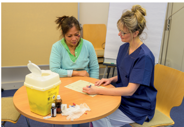
BtM-Dokumentation in Anwesenheit von einem Zeugen (4-Augen-Prinzip)