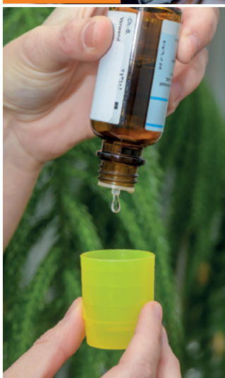
Flasche beim Tropfen senkrecht halten