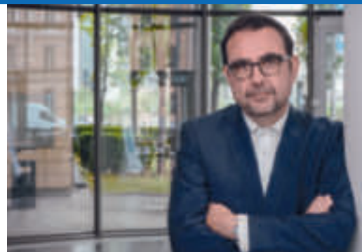
Gesundheitsminister Klaus Holetschek

Im vergangenen Juni haben wir in Bayern die Social-Media-Kampagne „Du Entscheid! Organspende? Deine Wahl.“ gestartet und waren damit sehr erfolgreich. Ziel war es, das Bewusstsein für das Thema Organspende zu schärfen. Dies ist uns mit 1,7